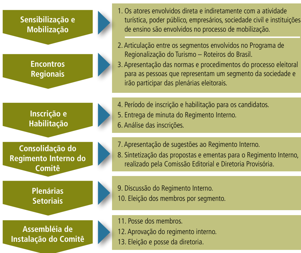
Figura 4 – Esquema demonstrativo para a construção de um Comitê

Deve-se respeitar as características de cada região. A figura 4 apresenta um esquema de como criar um Comitê 1 .